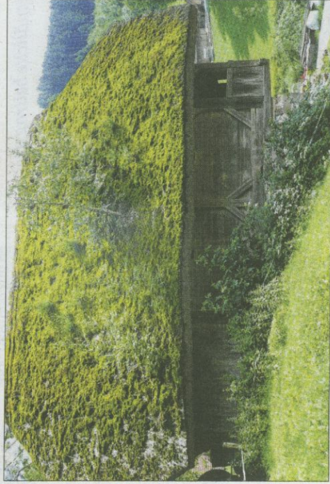
Den zweiten Platz belegte Hermann Schmid aus Hausach mit dem Bild »Extensive Dachbegrünung«.